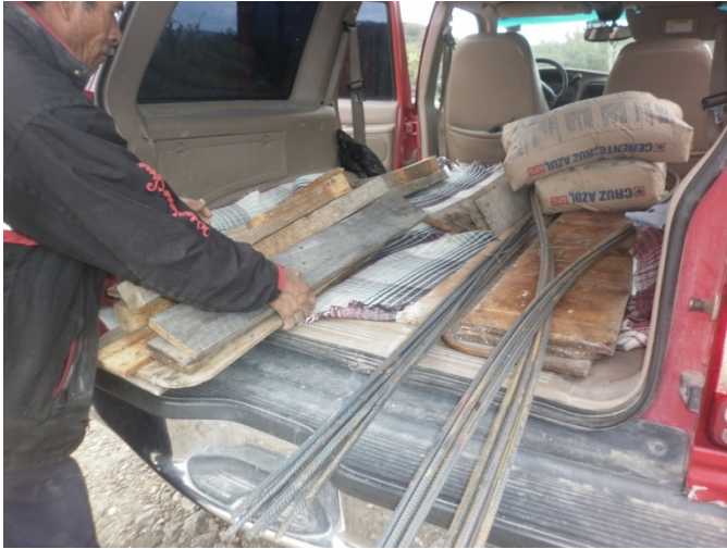
Adquisición de varilla, cemento grava y arena