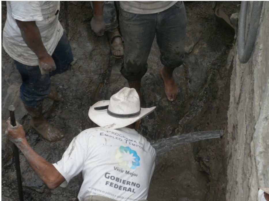
Salida de agua del tanque de captación