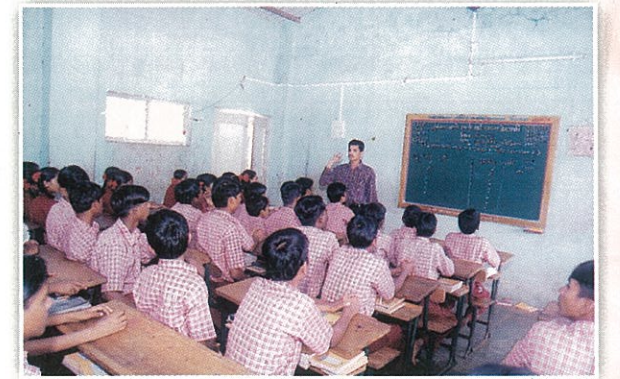
शाळेतील वर्ग खोली